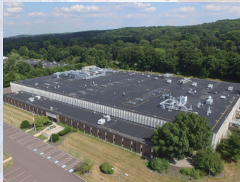
美国宾夕法尼亚州费城 (Wayne)

细胞系来源的生物制品具有病毒污染的固有风险，故进行病毒清除研究以确保患者安全至关重要，也是强制性的。我司在病毒清除项目方面拥有超 30 年的设计和执行经验，可确保为您进行智能、量身定制的研究设计，提供及时的报告，并确保项目最终成功且富有成本效益。我们在欧洲和美国的实验室可以帮助您设计和执行定制化研究。